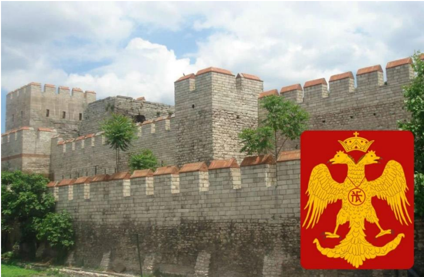
Muur van Constantinopel ( muur van Theodosius)

Het Byzantijnse Rijk, dat van 330 tot 1453 heeft bestaan, wordt ook wel eens Byzantium of het Oost- Romeinse Rijk genoemd. In dit artikel wordt de geschiedenis van dit bijzondere rijk samengevat, voorzien van een tijdlijn. Welke bijzondere kenmerken had dit rijk? Hoe ontwikkelde het Oost-Romeinse Rijk zich in politiek , cultureel en sociaaleconomisch opzicht? En Welke fasen doorliep het Byzantijnse Rijk qua ontwikkelingen? Periodisering van het Byzantijnse Rijk (begin- en eindpunt, in drie fases) en de herkomst van de naam. Constantijn de Grote