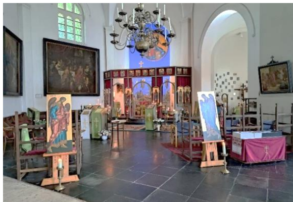
Kapel van de Sint Johannes van Damascus-gemeenschap in de St. Catharina kerk 's-Hertogenbosch Kruisbroedershof

Bezoek onze website: www.byzantijnsekapel.nl