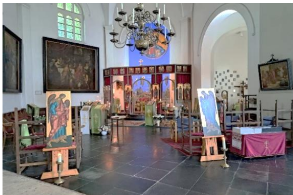
Sint Johannes van Damascus-gemeenschap in de St. Catharina kerk 's-Hertogenbosch

Bezoek onze website: www.byzantijnsekapel.nl