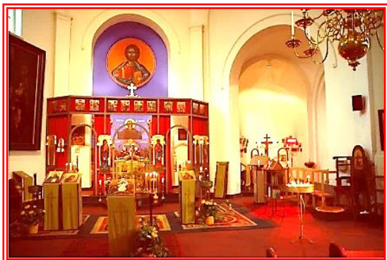
Kapel van de Johannes van Damascus-gemeenschap 's-Hertogenbosch

Bezoek onze website: www.byzantijnsekapel.nl